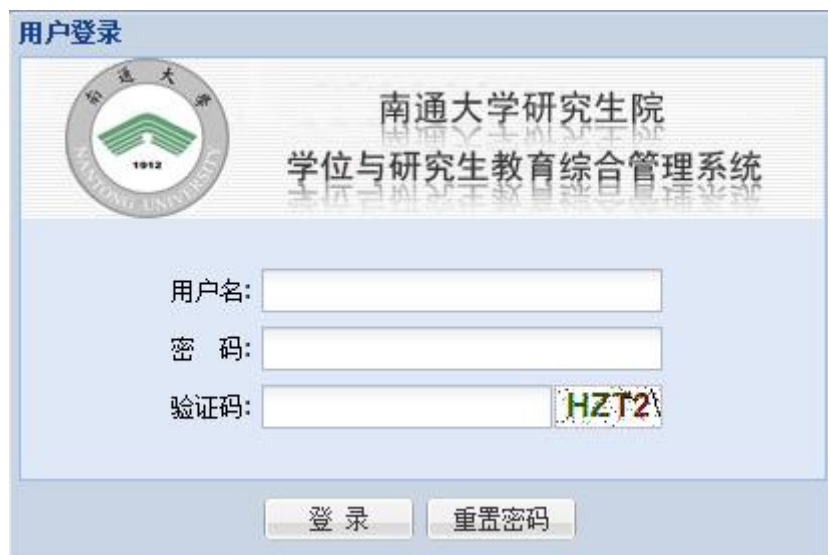
图 1 登录页面